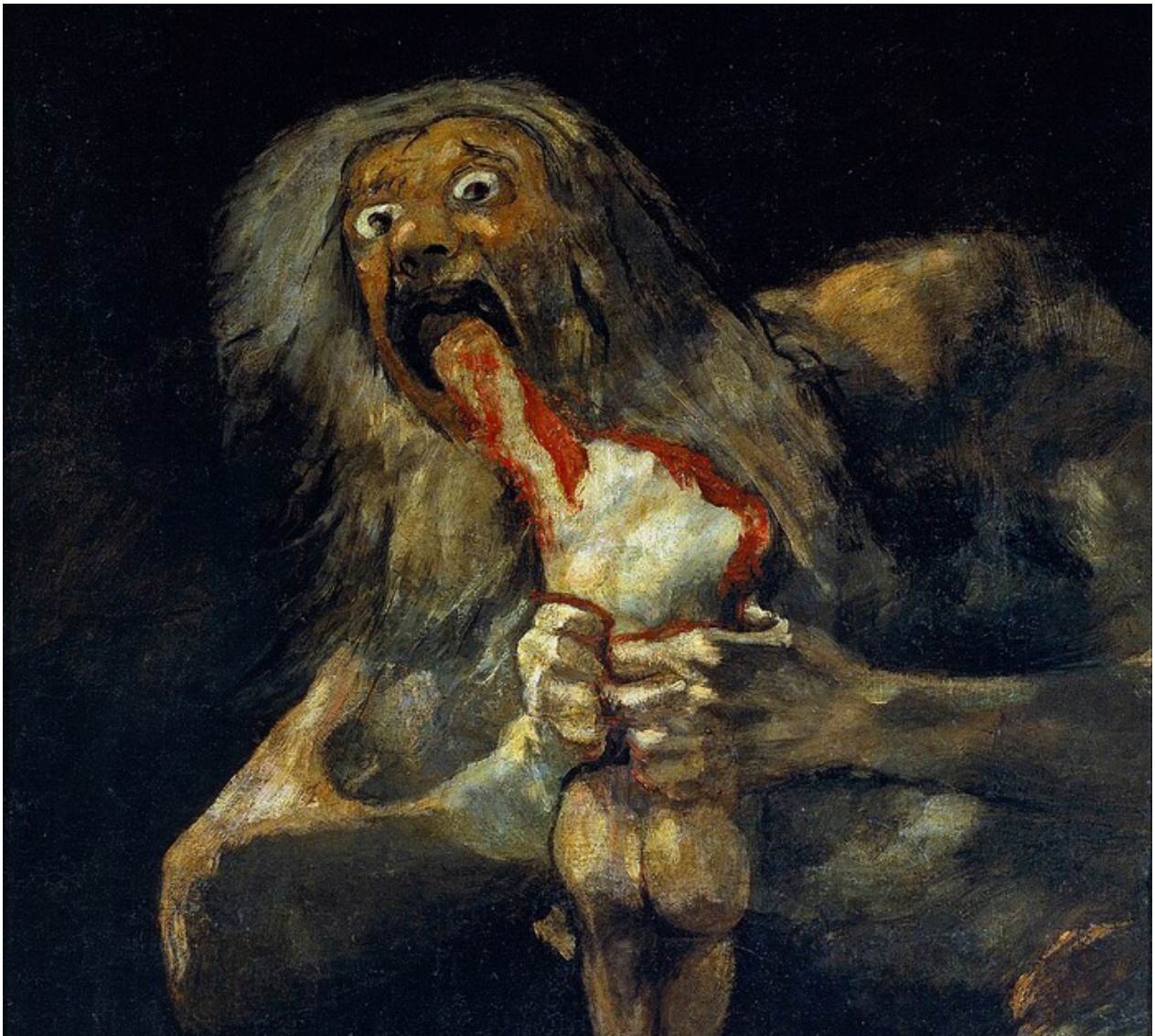
Saturne dévorant un de ses fils , Francisco de Goya, 1823